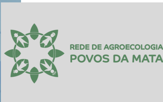
Rede de produtores agroecológicos .