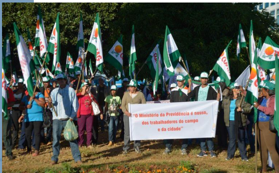
Manifestação de trabalhadores rurais.