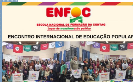
Escola de Formação da Contag .

Por g1 MT 06/05/2025 15h14 - Atualizado há 9 meses