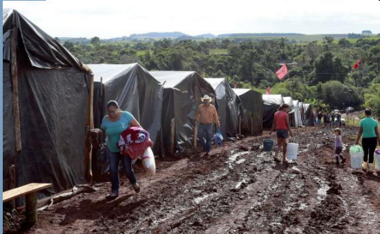
Ocupação no Paraná .