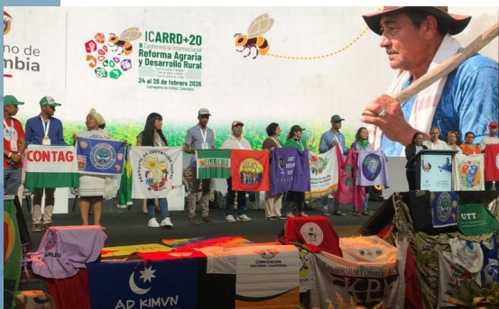
Entidades e movimentos do campo em conferência sobre reforma agrária .