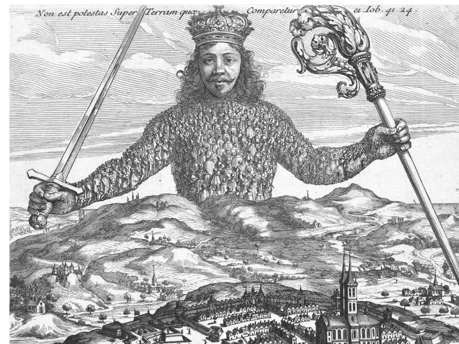
Capa de Leviatã , obra de Hobbes

Devido à sua origem e função, o Estado, para Hobbes, deve ser absoluto, indivisível e inquestionável . Esse poder é representado na obra Leviatã , do autor. Trata-se de um monstro que simboliza o Estado: um homem artificial cuja armadura é formada pelos súditos. Ele representa a fusão dos indivíduos em um único corpo político , no qual a autoridade suprema é centralizada no soberano .