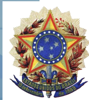
Brasão de Armas do Brasil no início do período republicano.

Lei de Terras de 1850 estabeleceu a compra como única forma de adquirir terras no Brasil, concentrando o direito à terra em poucos proprietários .