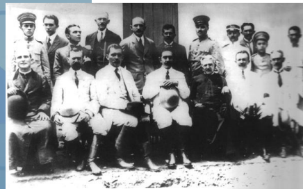
Coronéis reunidos em 1911 no Ceará.