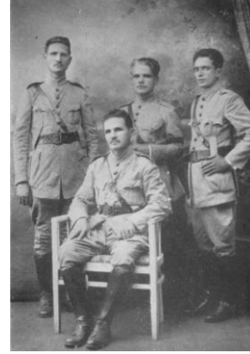
No centro, o titular da patente militar de Coronel.