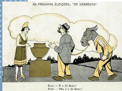
Charge de 1927 da revista Careta ilustra o voto de cabresto.