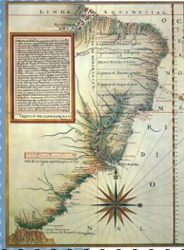
Mapa de 1574 com a divisão das Capitanias Hereditárias.