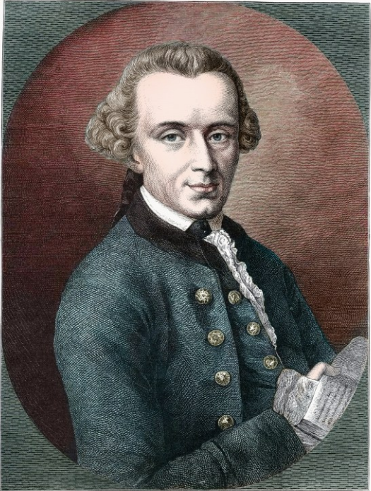
Immanuel Kant (1724–1804).