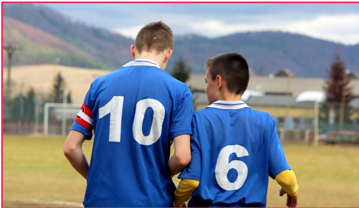
Jovens jogadores no campo de futebol

Se você tivesse de explicar este tema para algum colega que faltou às aulas, o que você destacaria quanto ao conteúdo e às reflexões?