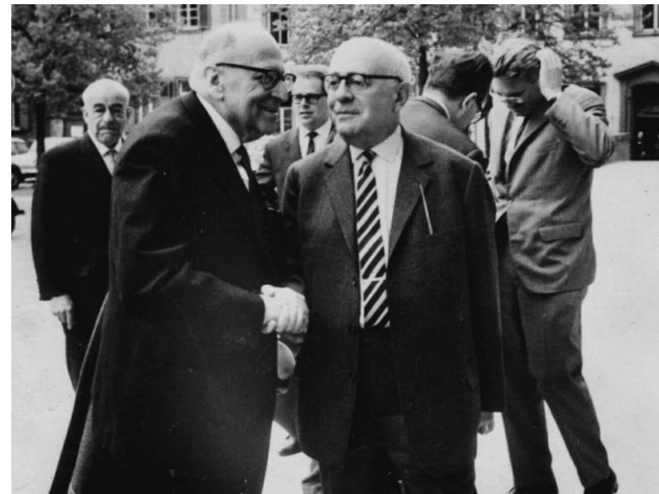
Horkheimer (à esquerda) e Adorno (à direita).

Theodor Adorno (1903–1969) e Max Horkheimer (1895–1973) foram importantes integrantes da primeira geração da Escola de Frankfurt. Formulado inicialmente por Horkheimer e mobilizado na obra conjunta Dialética do esclarecimento , o conceito de razão instrumental está no centro das análises críticas dos frankfurtianos sobre as sociedades industriais contemporâneas , os processos históricos e os fenômenos culturais que as constituíram.