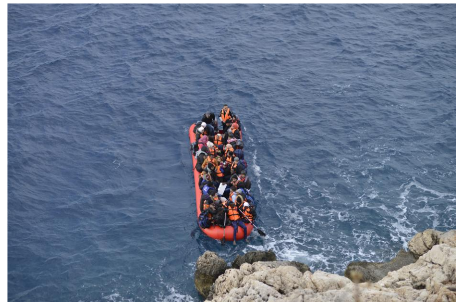
Rota migratória do Mediterrâneo.