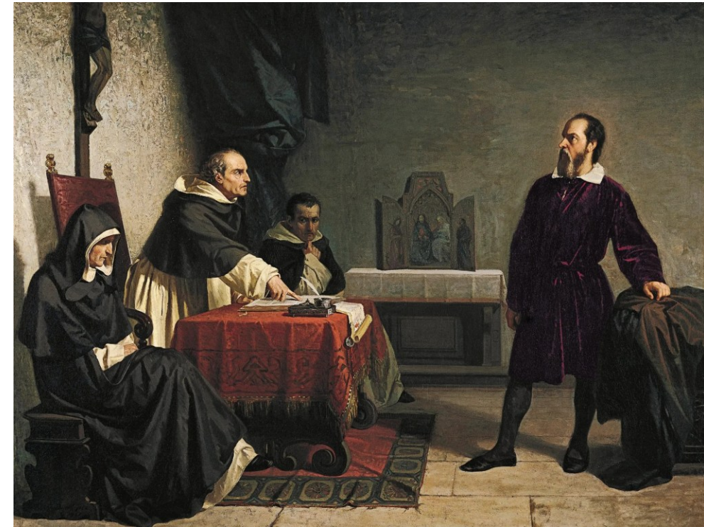
Galileu enfrentando a Inquisição romana. Disponível em: https://pt.wikipedia.org/wiki/Ficheiro:Galileo_facing_the_Roman_Inquisition.jpg . Acesso em: 03 dez. 2025.

O Renascimento, com sua visão de mundo humanista, criou as condições para que a Revolução Científica, que inaugura a Modernidade, pudesse ter lugar. Sem a mudança de mentalidade promovida pelo humanismo, que coloca o ser humano em condições de almejar o conhecimento do mundo a partir de sua própria capacidade racional , as grandes descobertas de Copérnico, Bruno e Galileu seriam impensáveis.