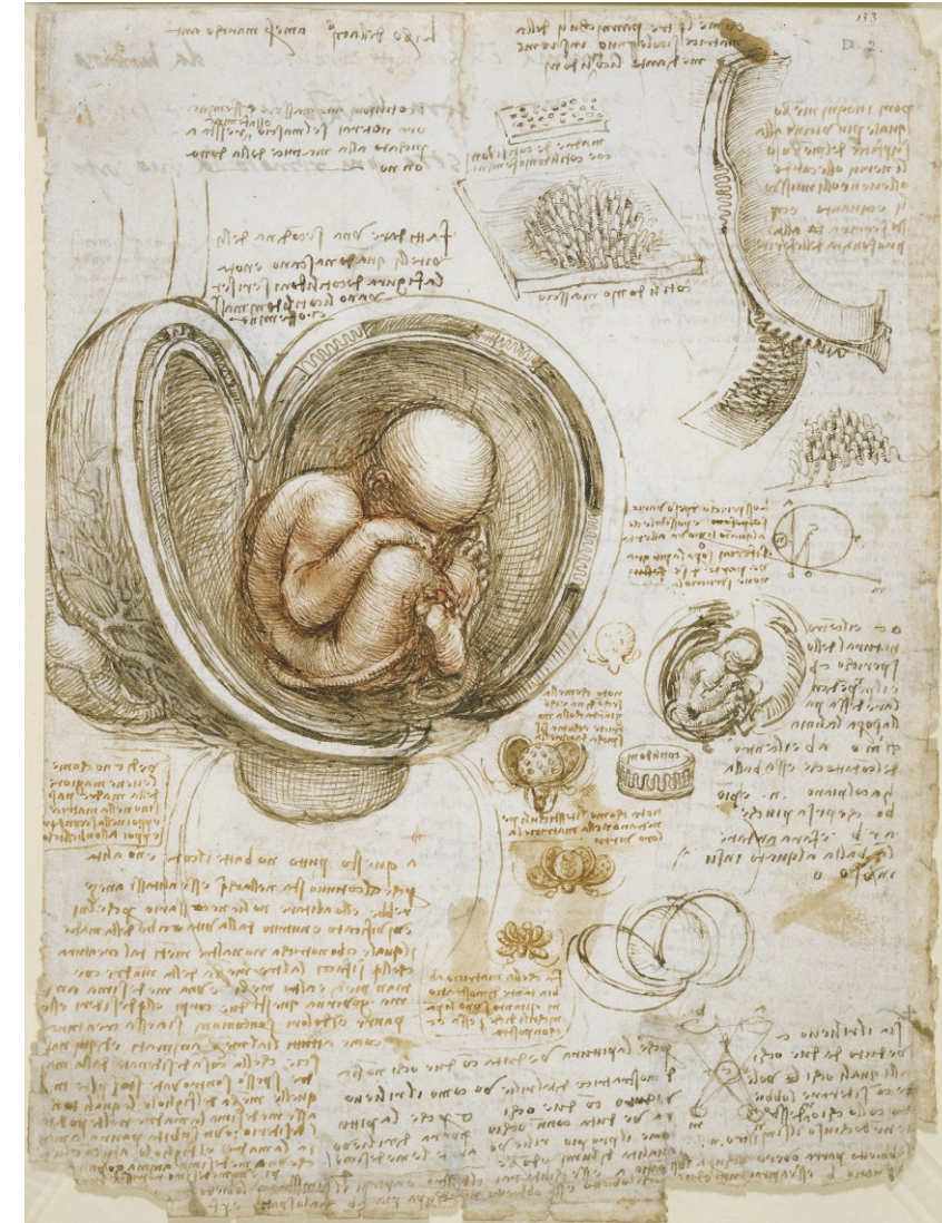
Manuscrito de Leonardo da Vinci. Disponível em: https://pt.wikipedia.org/wiki/Ficheiro:Leonardo_da_Vinci_-_Studies_of_the_foetus_in_the_womb.jpg . Acesso em: 4 dez. 2025.

O Renascimento foi marcado por um movimento artístico, científico, econômico, intelectual e político entre os séculos XIV e XVI. Esse movimento caracterizou-se pela valorização de autores e ideias da Antiguidade greco-romana, para além da tradição do aristotelismo, e pelo declínio da estrutura político-social que marcou a Idade Média.