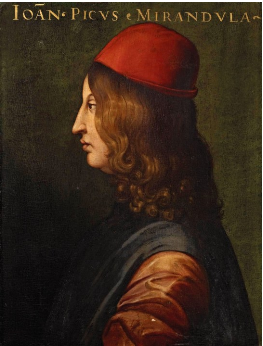
Retrato de Mirandola.

Inspirados pelos textos e pela cultura dos antigos gregos e romanos, os humanistas defendiam que, por meio da educação e do estudo , o homem poderia desenvolver todo o seu potencial. Ou, ao contrário, a negligência em sua formação poderia fazer o ser humano descender na cadeia da criação.