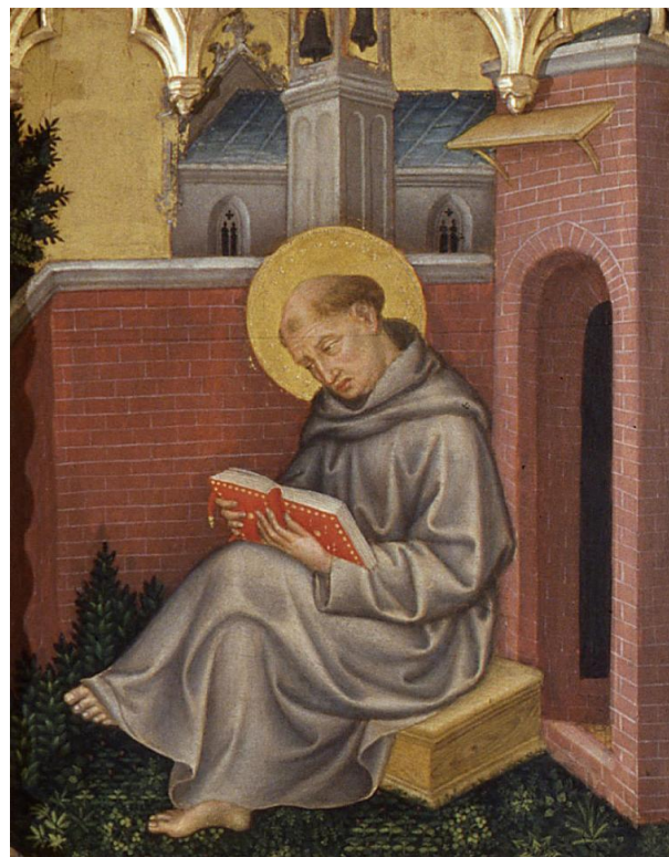
Tomás de Aquino.

Gentile da Fabriano, domínio público, via Wikimedia Commons. Disponível em: https://upload.wikimedia.org/wikipedia/commons/0/05/Benozzo_Gozzoli_004a.jpg .