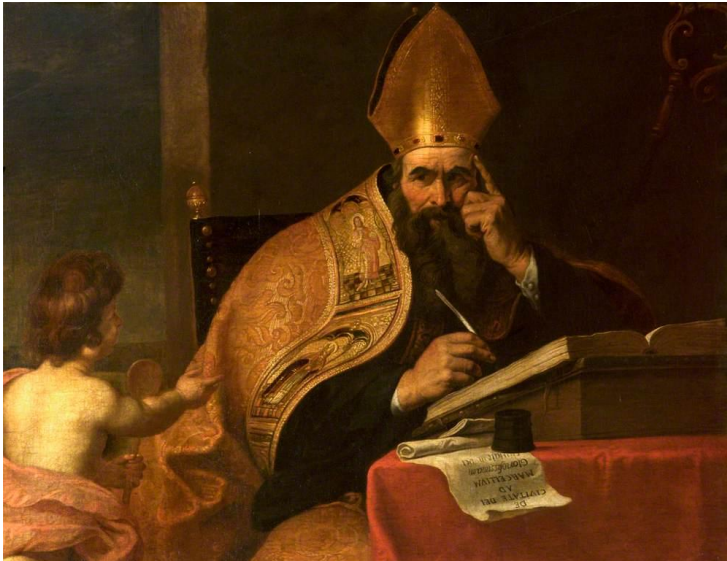
Os 4 Doutores da Igreja Occidental, Agostinho de Hipona (354 d.C. – 430 d.C.)

Atribuído a Gerard Seghers, domínio público, via Wikimedia Commons. Disponível em: https://upload.wikimedia.org/wikipedia/commons/c/c2/Gerard_Seghers_%28attr%29_-_The_Four_Doctors_of_the_Western_Church%2C_Saint_Augustine_of_Hippo_%28354%E2%80%933430%29.jpg . Acesso em: 14 fev. 2026.