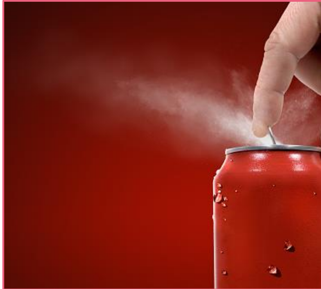
Lata de alumínio vermelha.

Uma lata vermelha é apenas uma lata, ou não? Vem algum produto à sua mente?