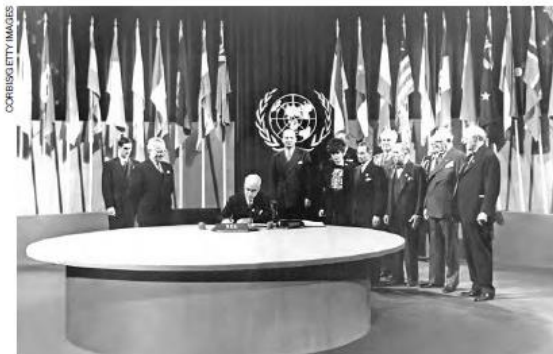
Cerimônia em junho de 1945, em São Francisco, Estados Unidos, na qual representantes de diferentes países assinaram a Carta das Nações Unidas , que criou a base regimental para a fundação da Organização das Nações Unidas, que ocorreria em 24 de outubro do mesmo ano.

Nesse contexto, logo após o fim da guerra, em 24 de outubro de 1945, foi criada a Organização das Nações Unidas , por 51 países, que estavam dispostos a garantir a paz e evitar a repetição das atrocidades cometidas durante as duas grandes guerras. Em 2023, faziam parte da instituição internacional 193 países.