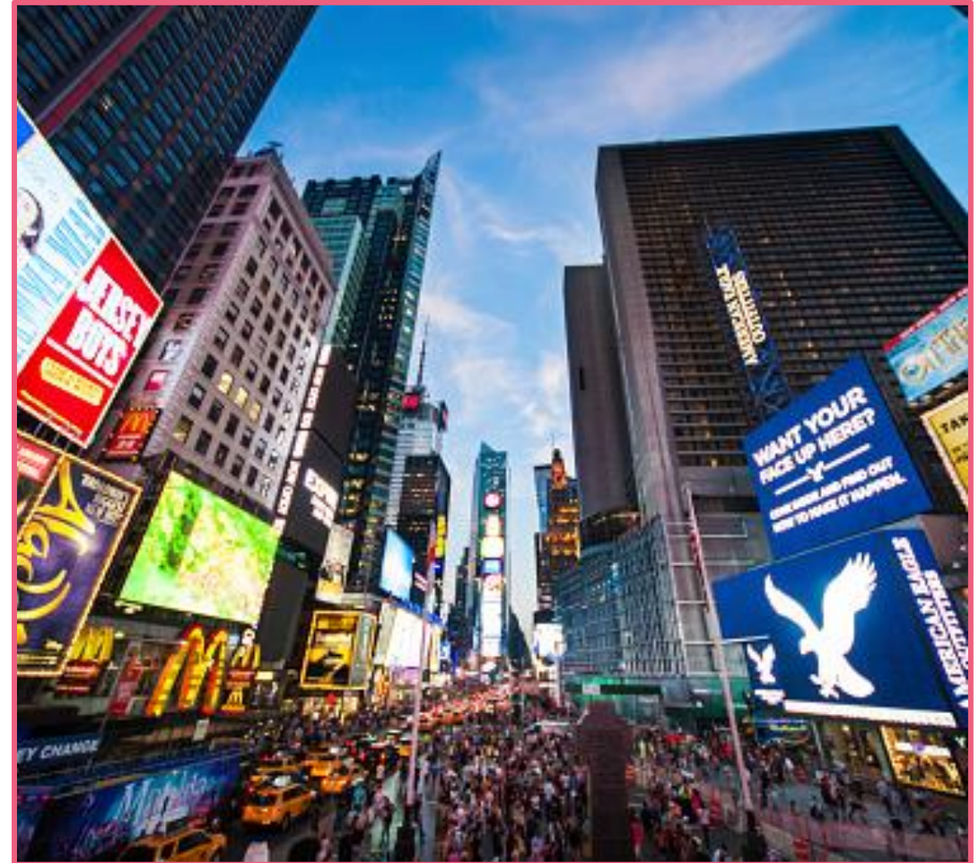
Propaganda de marcas globais na Times Square – NY.