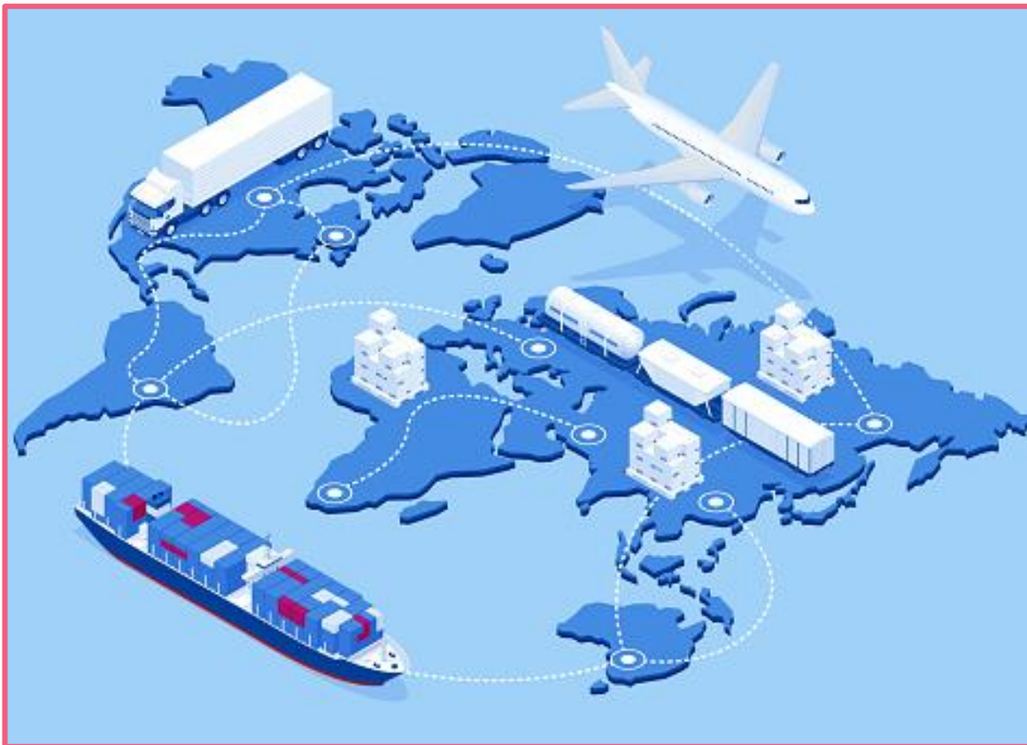
Transporte de mercadorias em escala global.