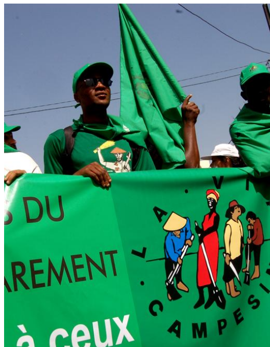
Representantes da Via Campesina.

Essas redes mostram que a globalização também pode ser construída “de baixo para cima” .