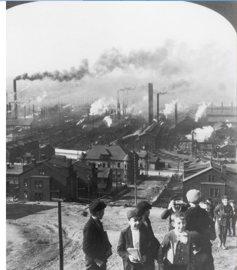
Pittsburgh, EUA (1877).

Disponível em: https://www.visitthecapitol.gov/artifact/pittsburghs-steel-mills-propelled-industrial-prosperity-left-its-residents-living-smoke