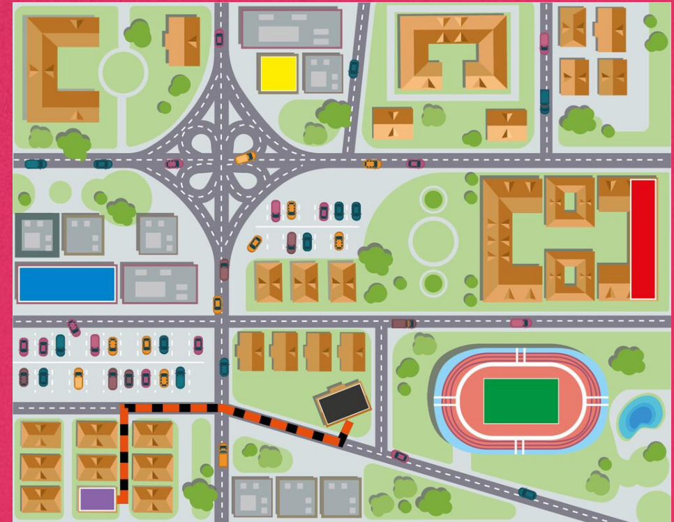
Croqui de uma cidade