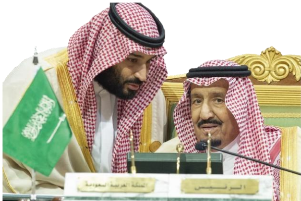
Salman bin Abdulaziz Al Saud (sentado), rei da Arábia Saudita , e seu filho, o príncipe herdeiro.