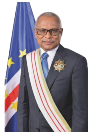
José Maria Pereira Neves, presidente eleito da República de Cabo Verde

A autoridade da monarquia é legitimada pela tradição e/ou por crenças religiosas.