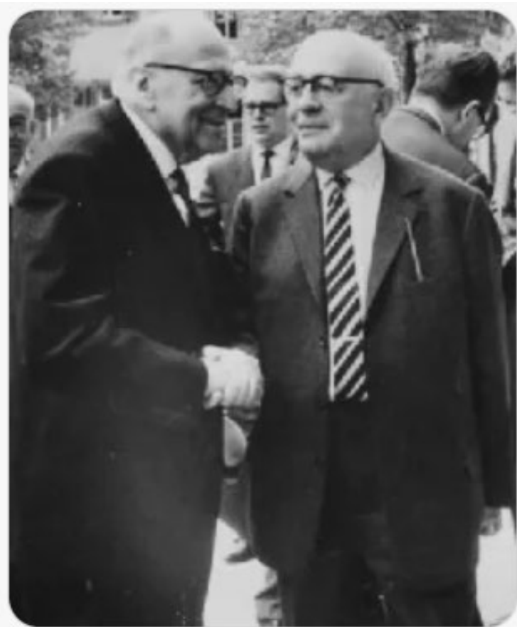
Theodor Adorno e Max Horkheimer