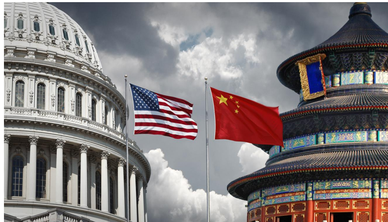
A guerra comercial entre EUA e China.