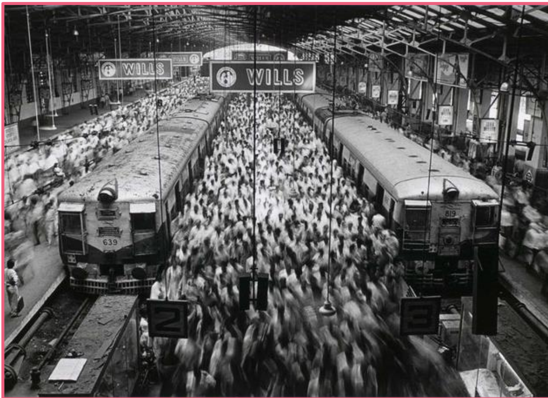
Fotografia de Sebastião Salgado. Church Gate, estação terminal da Western Railroad Line, Índia.

Reprodução – SEBASTIÃO SALGADO/ICP, 2007. Disponível em: https://www.icp.org/browse/archive/objects/church-gate-is-the-terminus-station-of-the-western-railroad-line-built-by-the . Acesso em: 27 dez. 2024.