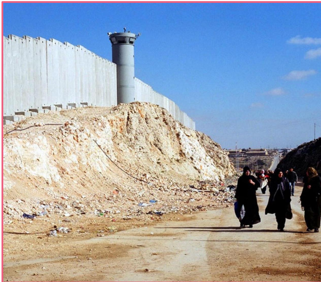
Mulheres palestinas andam perto do muro que separa a Cisjordânia de Israel.

Vamos ver alguns exemplos nos próximos slides.