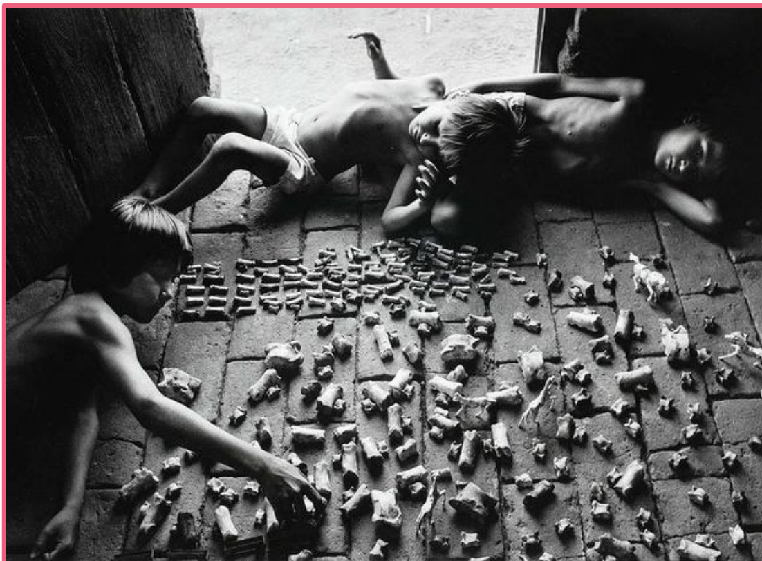
Fotografia de Sebastião Salgado. Brincadeiras infantis no Nordeste brasileiro durante a grande seca, Brasil.

Reprodução – SEBASTIÃO SALGADO/ICP, 2007. Disponível em: https://www.icp.org/browse/archive/objects/childrens-games-in-brazils-northeast-during-the-great-drought-brazil . Acesso em: 27 dez. 2024.